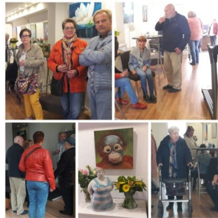
Opening Zuidijk 91

Op maandag 1 mei was de officiële opening van ons uitgebreide pand. Er was veel belangstelling en het was een gezellige middag.